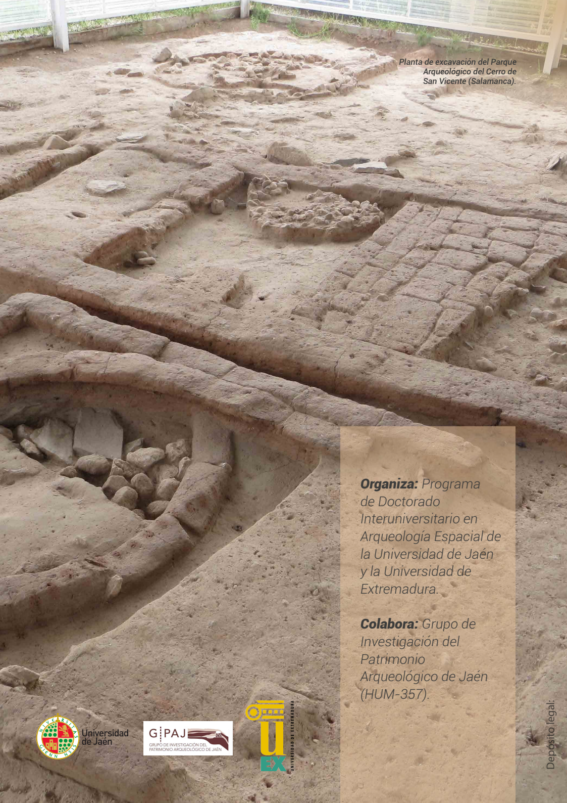
Planta de excavación del Parque Arqueológico del Cerro de San Vicente (Salamanca).